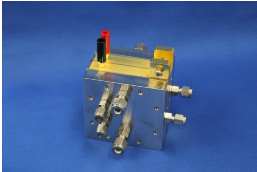
水電解式水素発生セル